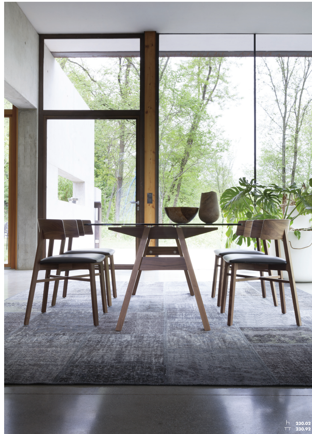
H 230.02 TT 230.92