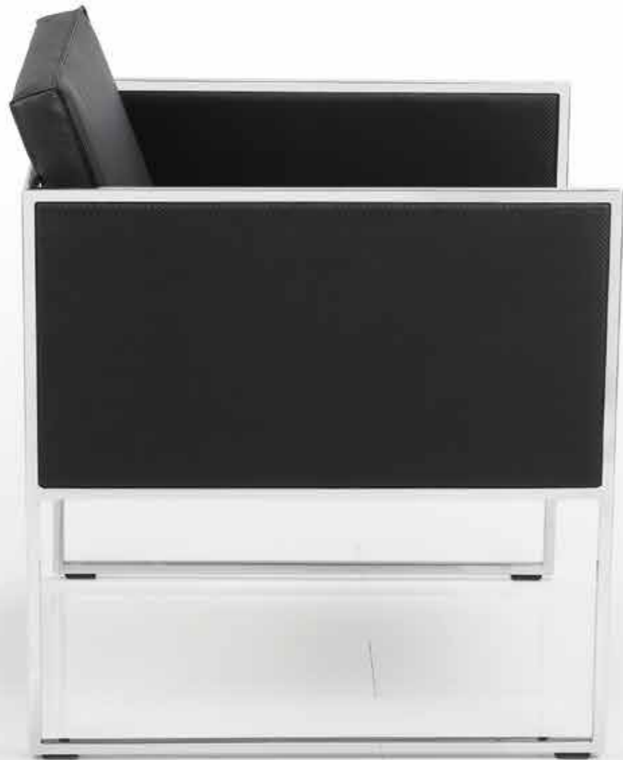
LINKS: GRACE, MARKANT INTERPRETIERT, MIT GESCHLOSSENEN ARMLEHNEN, LEDERBEZOGEN. RECHTS: GEOMETRISCH INSPIRIERTER SSEL GRACE CUT-OUT MIT ZUSÄTZLICHEN RUNDEN ÖFFNUNGEN.