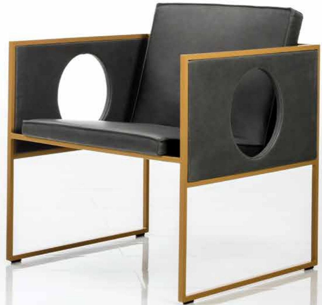
THE LEFT IMAGE SHOWS GRACE IN A STRIKINGLY LINEAR DESIGN, WITH CLOSED, LEATHER-COVERED ARMRESTS. THE GEOMETRICALLY INSPIRED ARMCHAIR ON THE RIGHT FEATURES ADDITIONAL ROUND CUT-OUTS.