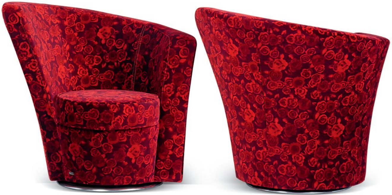
A 144 LI / RE EVE'S ISLAND ▶ 89 CM ▶ 177 CM ▶ 90 CM STOFF · TISSU · FABRIC 64 4115