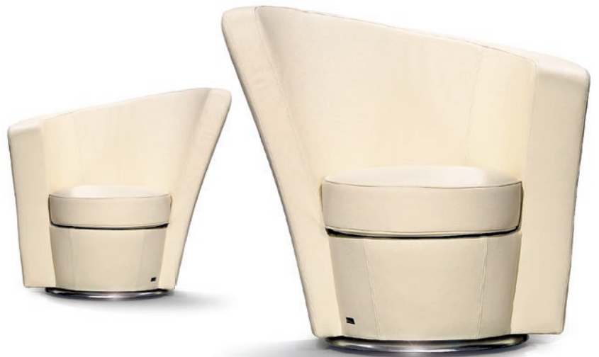
A 144 RE / LI EVE'S ISLAND ▶ 89 CM ▶ 177 CM ▶ 90 CM LEDER · CUIR · LEATHER 70 N3819